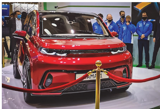
Рис. 2. Электромобиль «КАМА-1» компании «КамАЗ»

Электромобиль «КАМА-1» представляет собой трехдверный кроссовер, рассчитанный на перевозку четырех человек (рис. 2). Автомобиль имеет в длину 3,4 метра, в ширину 1,7 метра и в высоту 1,6 метра. Клиренс электромобиля составляет 160 миллиметров. Машина получила литий-ионный аккумулятор емкостью 33 киловатт-час и электромотор мощностью 80 киловатт.